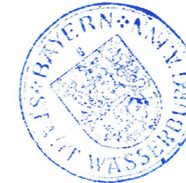
Michael Kölbl 1. Bürgermeister

9. Die Erteilung der Genehmigung der 10. Änderung des Flächennutzungsplanes wurde am 02.08.2019 gem. § 6 Abs. 5 BauGB in den Wasserburger Heimatnachrichten ortsüblich bekannt gemacht. Die 10. Änderung ist damit wirksam.